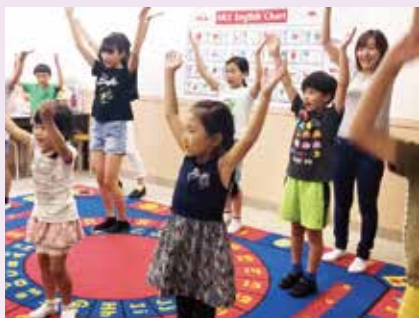
実際のリハーサルの雰囲気を実感できます

「合格した」という事実によって生徒たちに自信を持ってもらうために体験リハーサル(オーディション)を行います。参加者本人の「やる気」やディレクター(演出家)の指示にきちんと反応できるか、などが重視されます。